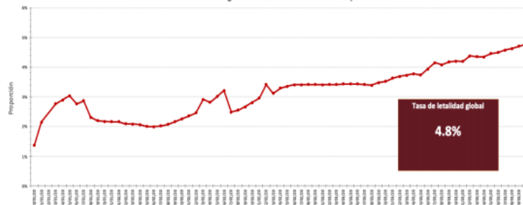
Gráfico 1. Tasa de letalidad* global de casos nuevos de COVID-19 por SARS-CoV-2